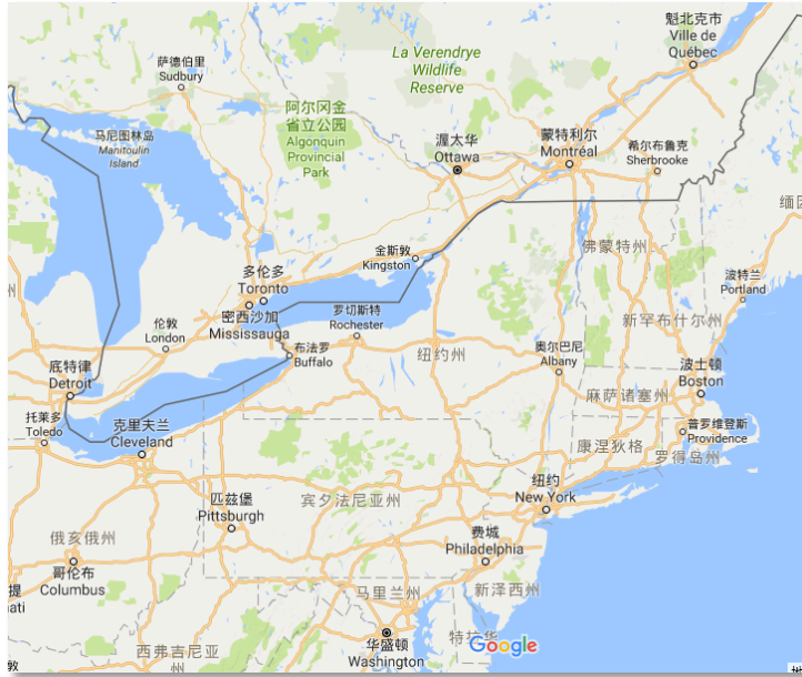
蒙特利尔周边主要城市：渥太华、魁北克、多伦多、纽约、华盛顿