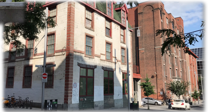
项目位置实时实景拍摄