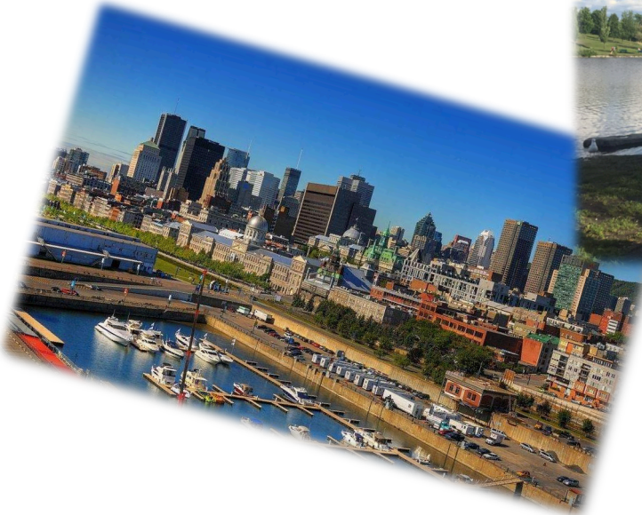
丰富的水资源 蒙城到处湖光山色