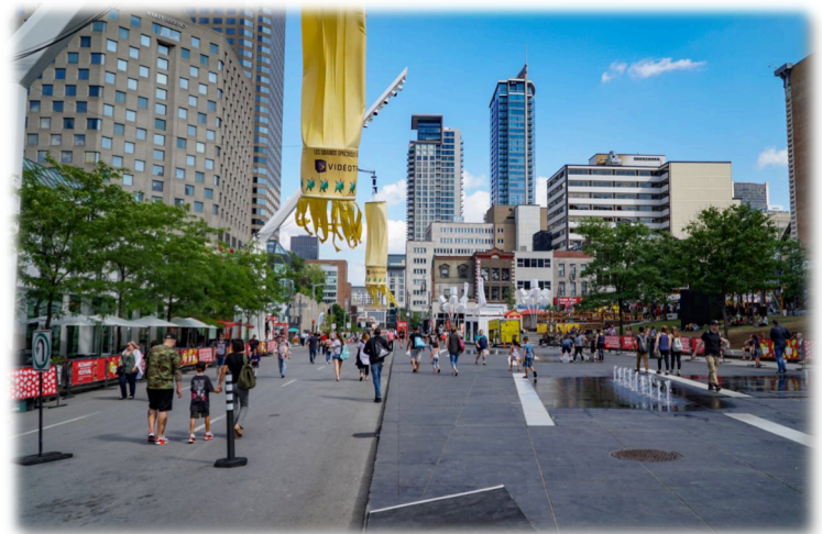
项目紧邻的艺术中心广场 每天上演各式大戏