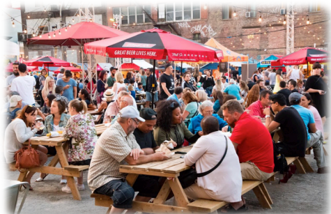
灯光节、音乐节、美食节、马戏节、烟火节、爵士音乐节 ……