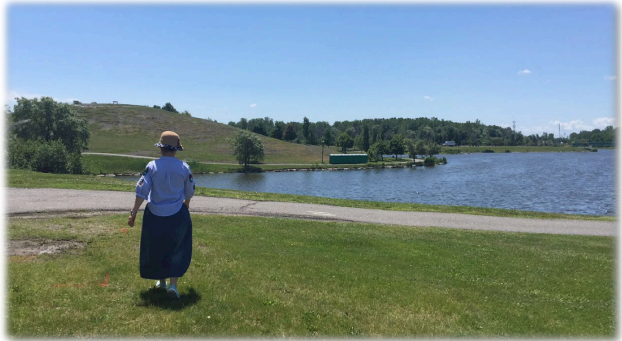
公共园林风景宜人