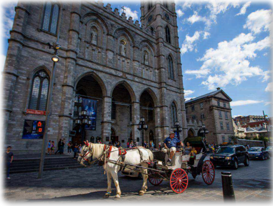
观光马车走在街上