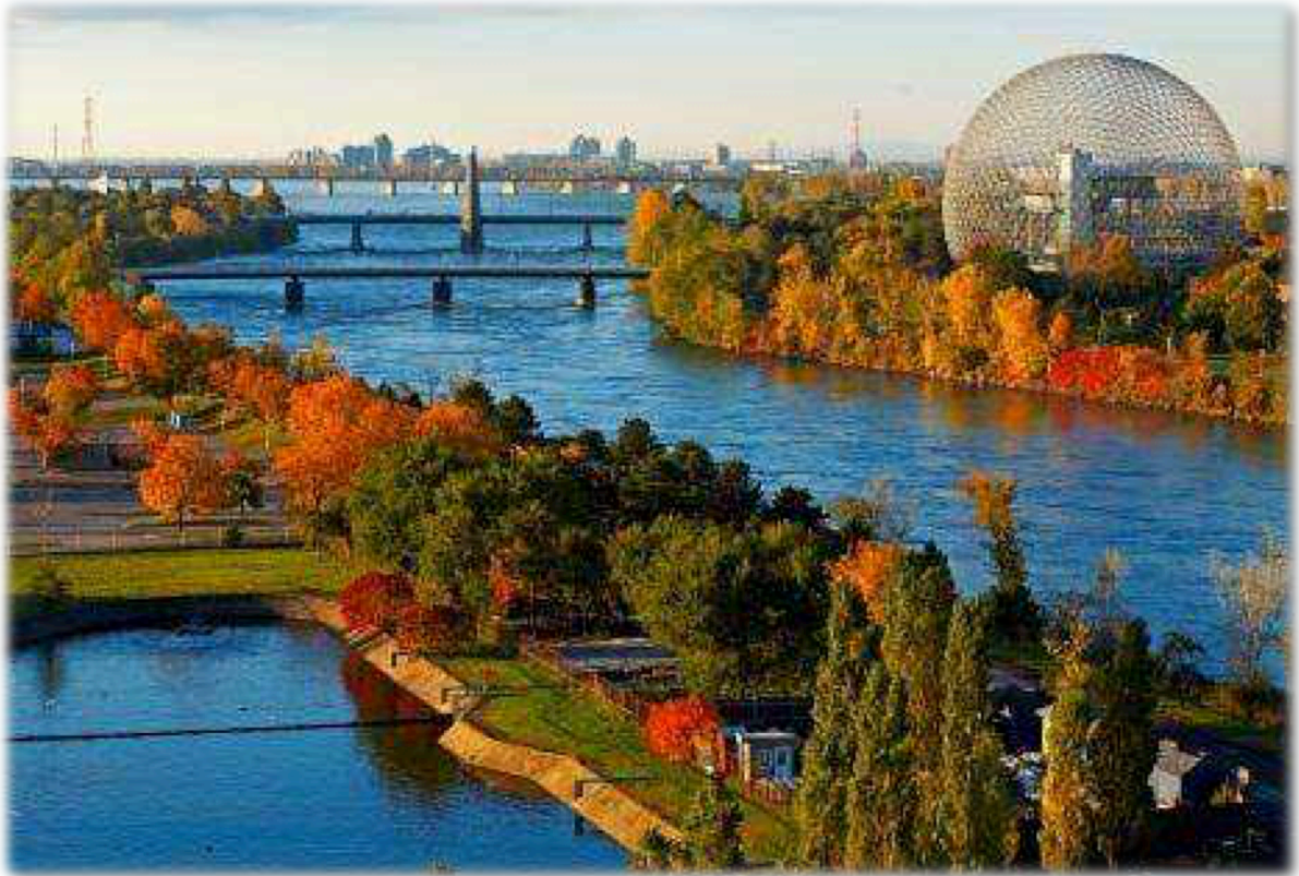
九月的蒙城万山红遍